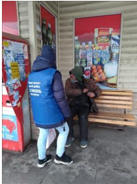
Социальный патруль Социальный патруль

Информация из этого раздела будет доступна для посетителей сайта оценка.гранты.рф (в том числе для представителей СМИ).