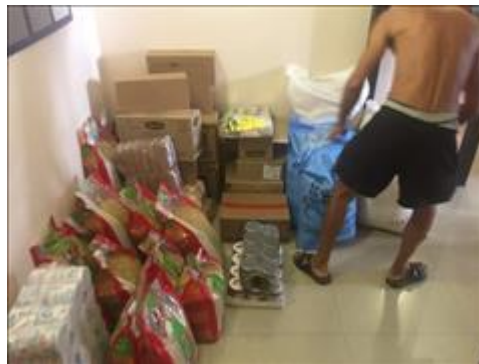
Закупка продуктов для подопечных центра Закупка продуктов для подопечных центра

Мероприятие: Устранить объективные причины препятствующие социализации