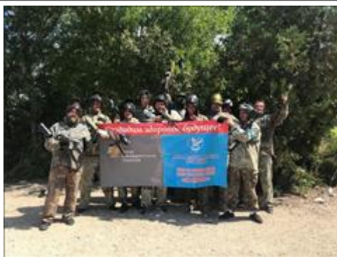
Организация досуга подопечных центра Организация досуга подопечных центра